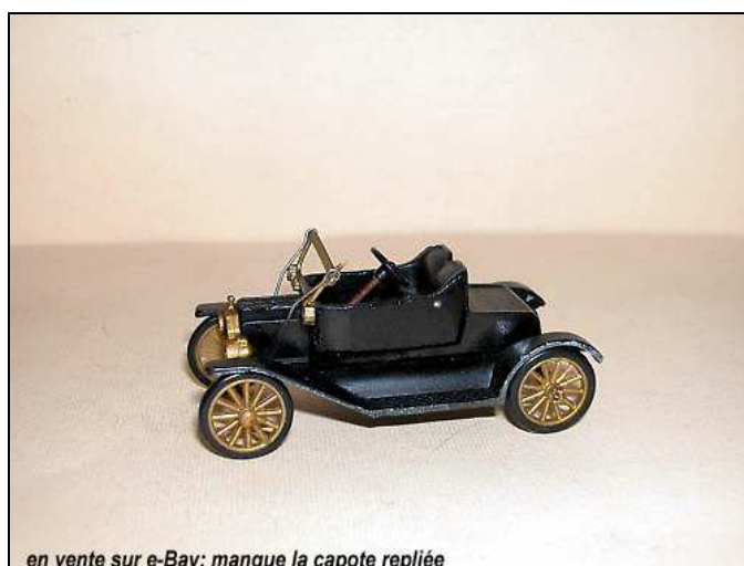
en vente sur e-Bay: manque la capote repliée