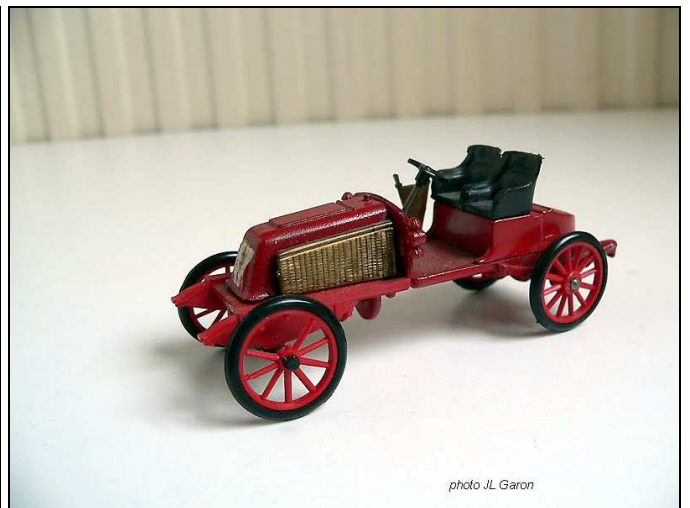
la Renault de la course Paris-Vienne 1902 par JADALI-SIFMA