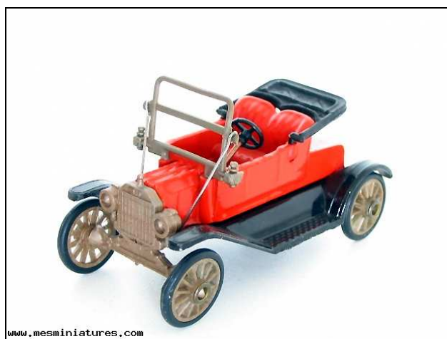
deux variantes de la Ford T "Lizzie" par SAFIR