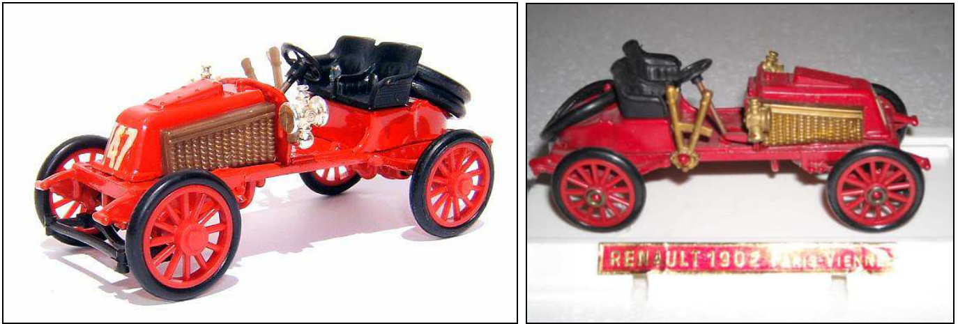
la Renault Paris-Vienne par SAFIR

Elles sont très rares sous le nom de JADALI-SIFMA. A partir du début de 1960, elles seront intégrées à la gamme et sous le nom de SAFIR.