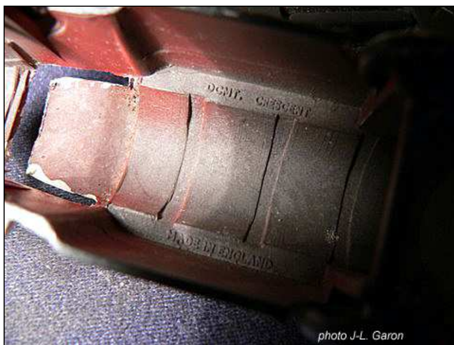
le camion citerne marqué DCMT-CRESCENT

Pour le moment, on ne connaît pas d'exemple de ce camion sans gravure ou avec une gravure indiquant qu'il aurait été produit en France par CABB sous le nom de LONESTAR-made in France ou de JADALI. En revanche, on en a trouvé un vendu en Espagne sous la marque JADALI-METAMOL et dont le moule a été modifié pour effacer les gravures (voir le chapitre 6).