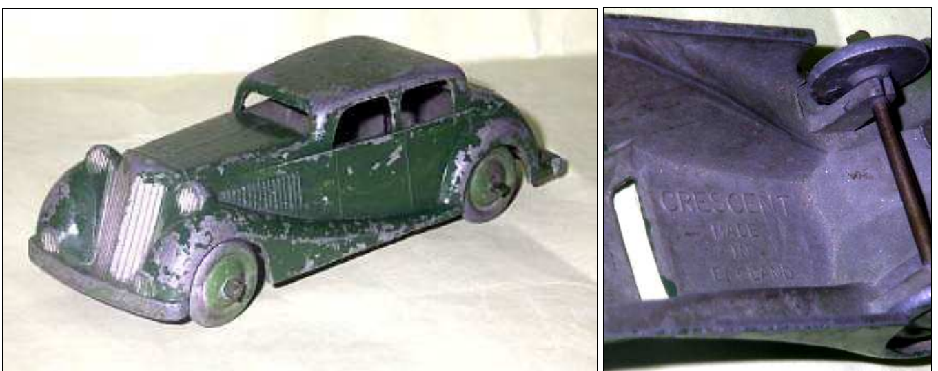
la berline Jaguar marquée CRESCENT made in England (source: http://thoshikawa.com/lonestar/IMPY/e-t-c.html )

Lorsqu'elle apparait dans la gamme CRESCENT, elle est identifiée comme une Jaguar.