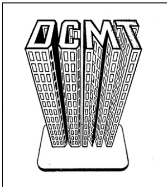
logo DCMT (1945)

Un dernier détail amusant qui montre combien les étroites relations tissées avec DCMT influencèrent profondément Léon Gouttman tout au long des années. Les logos de ses entreprises en France et en Espagne s'inspirent du logo original de DCMT :