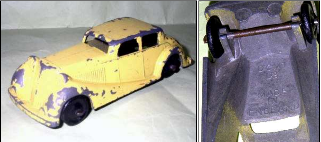
la berline type 1 marquée DCMT Ltd made in England

A aujourd'hui, nous n'avons aucune information qui pourraient faire penser que cette miniature a pu être incorporée dans la gamme de JADALI. Néanmoins, elle mérite d'être citée. On la connaît comme une DCMT (photo ci-dessous).