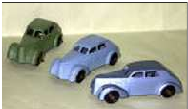
Plusieurs variantes de couleur de la berline La Salle