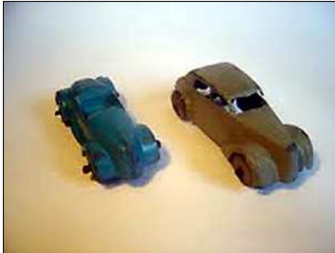
le roadster Nash et la berline La Salle

Pour le moment, on n'a pas d'exemple de cette voiture sans gravure ou avec une gravure indiquant qu'elle aurait été produite en France par CABB et vendue sous le nom de LONESTAR-made in France ou JADALI. En revanche, on en a trouvée une vendue en Espagne sous la marque JADALI-METAMOL et dont le moule a été modifié pour effacer les gravures (voir le chapitre 6).